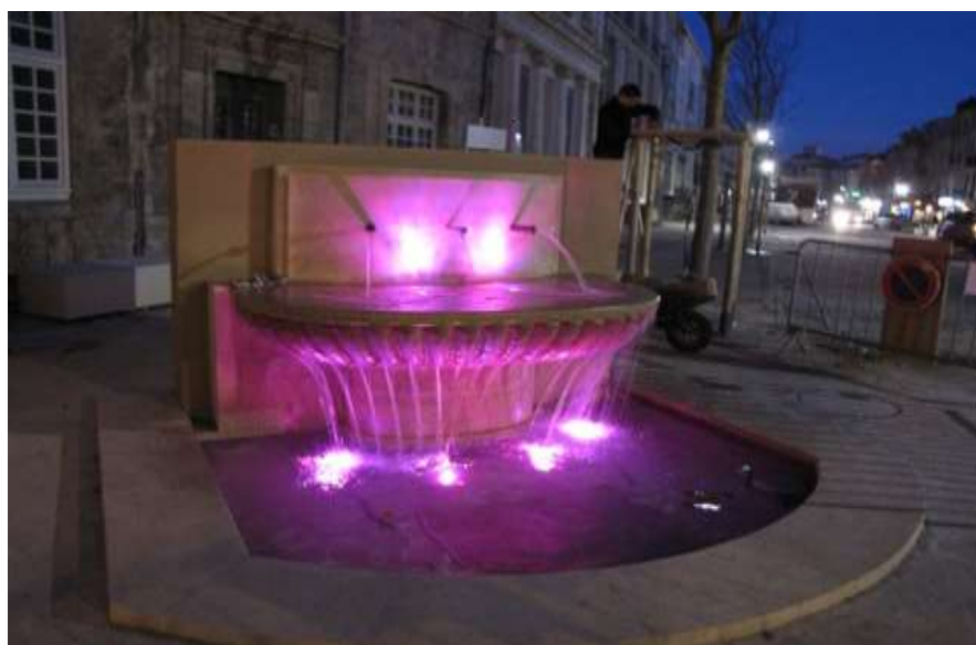
Essais de mise en lumière de l'une des fontaines du Quay, en entrée de Cours.

Les différents corps de métiers effectuent les dernières interventions pour que le Cours Jean Jaurès soit fin prêt pour l'inauguration, à laquelle tous les Piscénois sont invités, samedi 15 décembre, à 18h, avec un spectacle aérien féérique à voir en famille, avant de continuer la fête avec la sortie du Poulain.