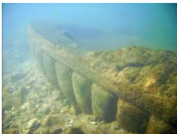
Fontaine immergée dans l'Hérault

Le projet de la Ville, pour redonner au Cours ses lettres de noblesse, est de sortir les fontaines de l'Hérault si leur état de conservation le permet, pour les restaurer et les replacer sur le nouveau Cours.