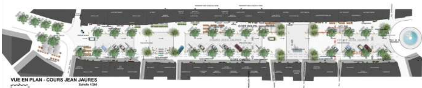
Schéma du projet de requalification actuellement à l'étude

Concept intégré au code de la route en 2008, il place le piéton au centre de l'aménagement où la voiture est invitée et sa vitesse limitée à 20 km/h, ce qui renforce la sécurité de chacun. Le nouveau Cours Jean Jaurès se présentera sans trottoir, sans bordures, ni contre-allées et voiries de différents niveaux. Sur 190 m de long et 22 m de large, la requalification en espace plan apporte une réponse actuelle, écologique et sécuritaire à l'embellissement et la convivialité du centre ville. Le Cours va devenir un espace à vivre à l'image d'une Place.