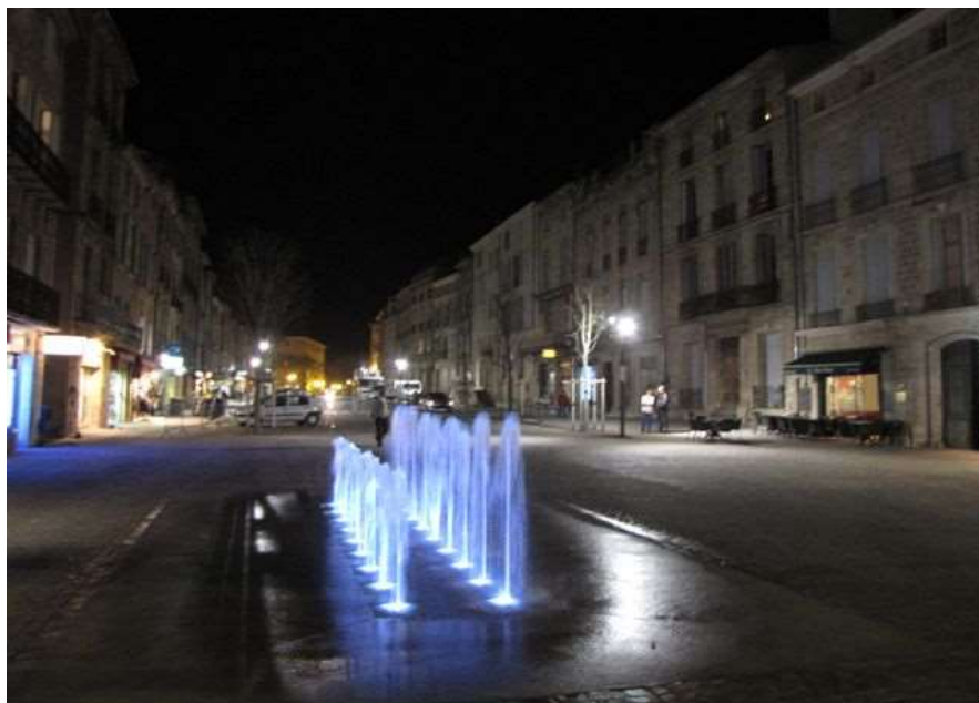
Mise en lumière de la fontaine aléatoire

L'implantation des candélabres et le réglage de l'éclairage public touchent à leur fin. Jeudi soir, les riverains, commerçants et passants ont pu assister aux essais de mise en lumière des fontaines du Quay restaurées et replacées en haut du Cours pendant que la fontaine aléatoire amusait les passants. Les micocouliers prennent racine sur le nouveau Cours et les bas des façades sont agréablement végétalisés.